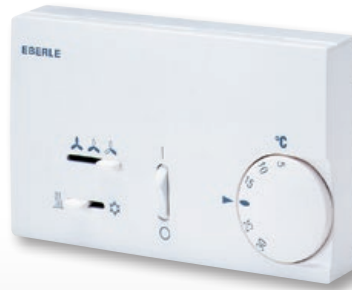
KLR-E 7015/KLR-E 7047